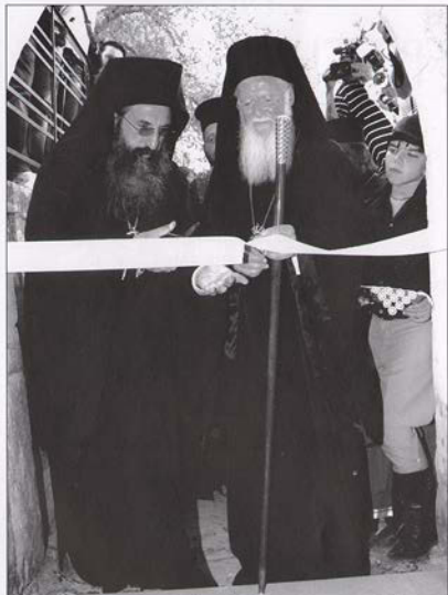
Ἡ Αὐτοῦ Θειοτάτη Παναγιότης, ὁ Οἰκουμενικός Πατριάρχης κ.κ. ΒΑΡΘΟΛΟΜΑΙΟΣ, τελεῖ τόν ἐγκαινισμόν τῶν χώρων τοῦ νέου μουσείου τῆς Ἱερᾶς Μονῆς Ἀρκαδίου κατὰ τήν πραγματοποιηθεῖσαν ἐκεῖσε ἐπίσημον ἐπίσκεψιν Αὐτοῦ τήν Δευτέραν 3ην Σεπτεμβρίου 2012.